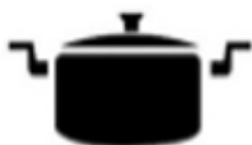
Rozsdamentes acél edény